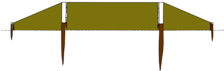
Schematische weergave van de Romeinse weg uit 124/125 zoals aangetroffen in Valkenburg ZH op het Marktveld en Veldzicht.

De ontdekking van de weg betekent de eerste mogelijkheid om het huidige onderzoek te laten aansluiten bij de grote opgravingen in Valkenburg in de 20 e eeuw. En zoals vooraf verwacht herbergt het noordoostelijke deel van het plangebied de uitlopen van de limes , de militaire zone die Valkenburg zo beroemd heeft gemaakt.